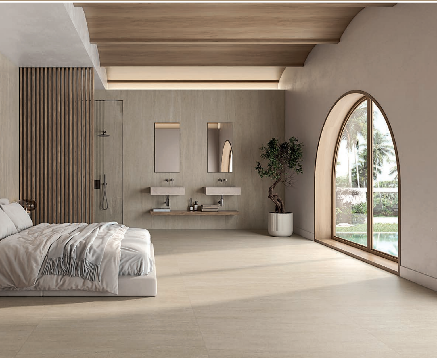
ROCA TILES, Serena Veincut.