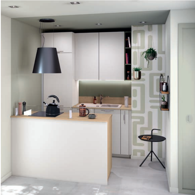
↑ Cocina compacta con península apuesta, de SOCOOC . Los muebles altos blanco mate aportan luminosidad y capacidad de almacenaje, mientras que la encimera efecto madera añade calidez. Los nichos abiertos, la iluminación integrada y los detalles en negro generan un equilibrio perfecto entre practicidad y carácter decorativo. www.socooc.es

El microliving plantea soluciones que combinan funcionalidad, optimización del espacio y estilo, en las que la cocina –centro neurálgico del hogar– adopta un enfoque renovado para dar respuesta a las necesidades de ambientes más eficientes y versátiles.