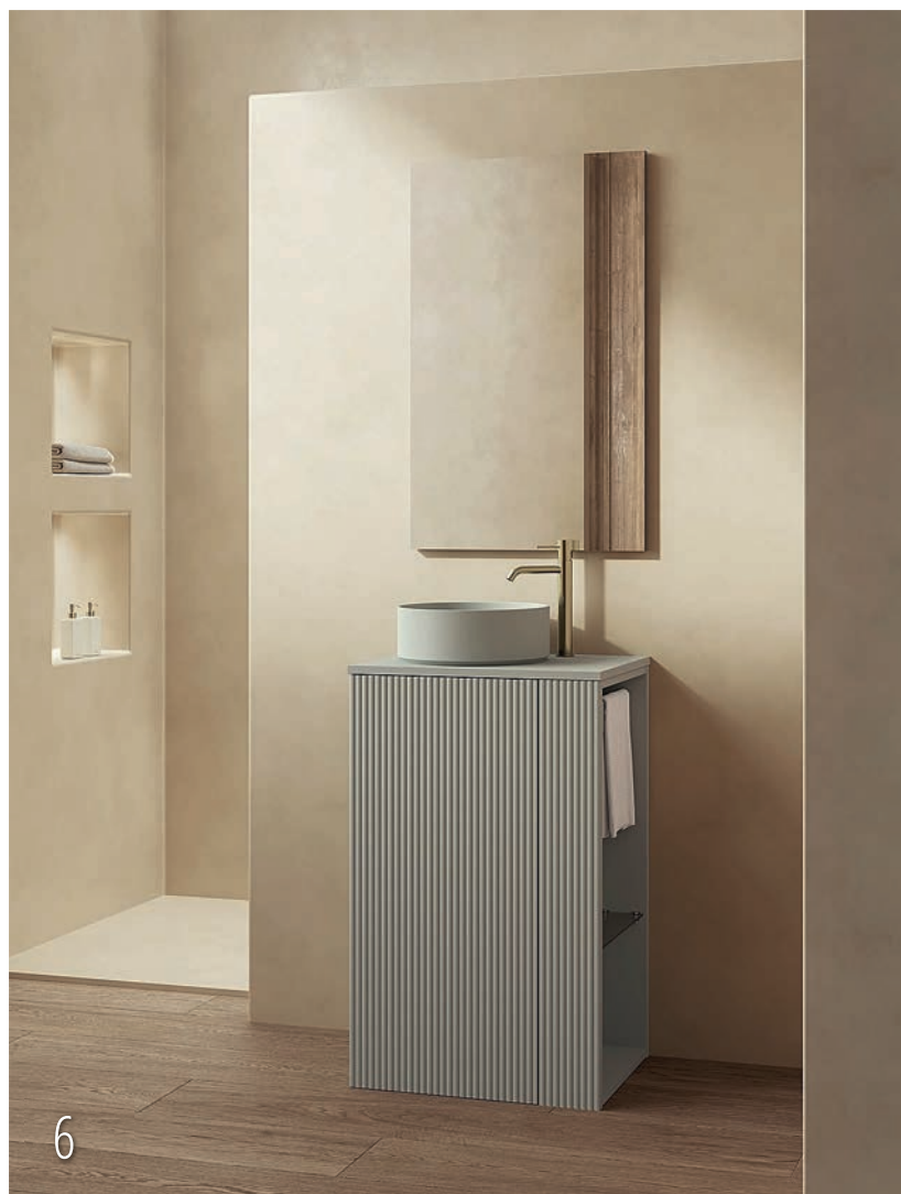
6. Bassi, de ROYO , es una serie compacta y funcional que destaca por su estructura tipo tótem. A ras de suelo y con un diseño estilizado, ofrece almacenamiento práctico a través de una puerta push-open y un estante lateral de cristal con toallero integrado. Disponible en varios acabados. www.royogroup.com