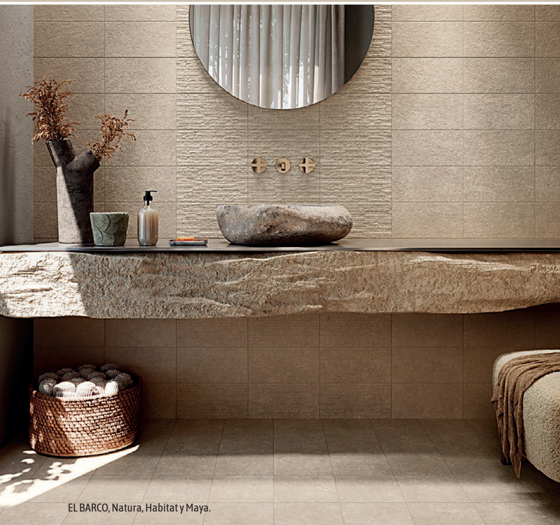
EL BARCO, Natura, Habitat y Maya.