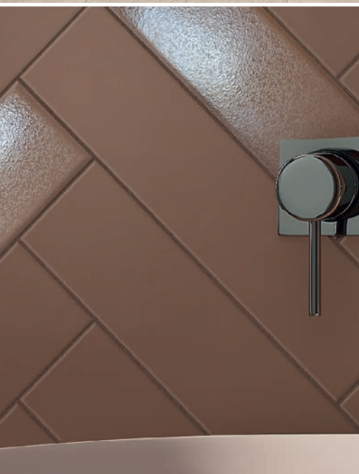
CERÁMICAS RIBESALBES, Terra.

Esta tendencia es la evolución del impulso geológico y primario, que transforma la tierra en relato, el estrato en superficie y la imperfección en belleza. Las superficies aquí son densas y texturizadas, exponiéndose sin filtros: rugosidades, erosiones y fragmentos. En un lenguaje que parece surgir directamente de una cantera, de un corte de tierra, de una excavación arqueológica contemporánea. La belleza no reside en la perfección, sino en la huella, creando espacios donde el material no solo se ve: se siente, se lee y se interpreta. Es tendencia reconfigura el espacio desde lo profundo y el diseño no decora, sino que construye, estratifica, recuerda y cada superficie cuenta una historia de transformación.