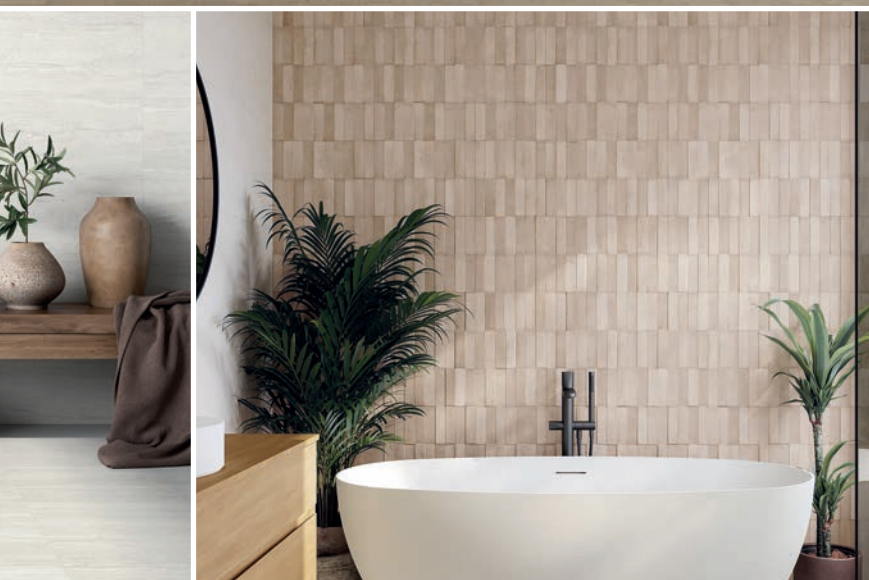
CIFRE CERÁMICA, Daster cream.