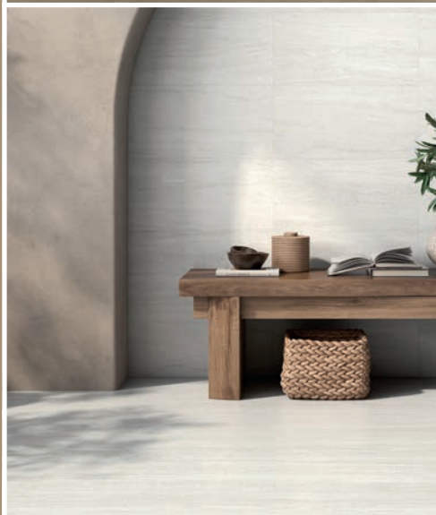
EL BARCO, Scale sand y grafito.