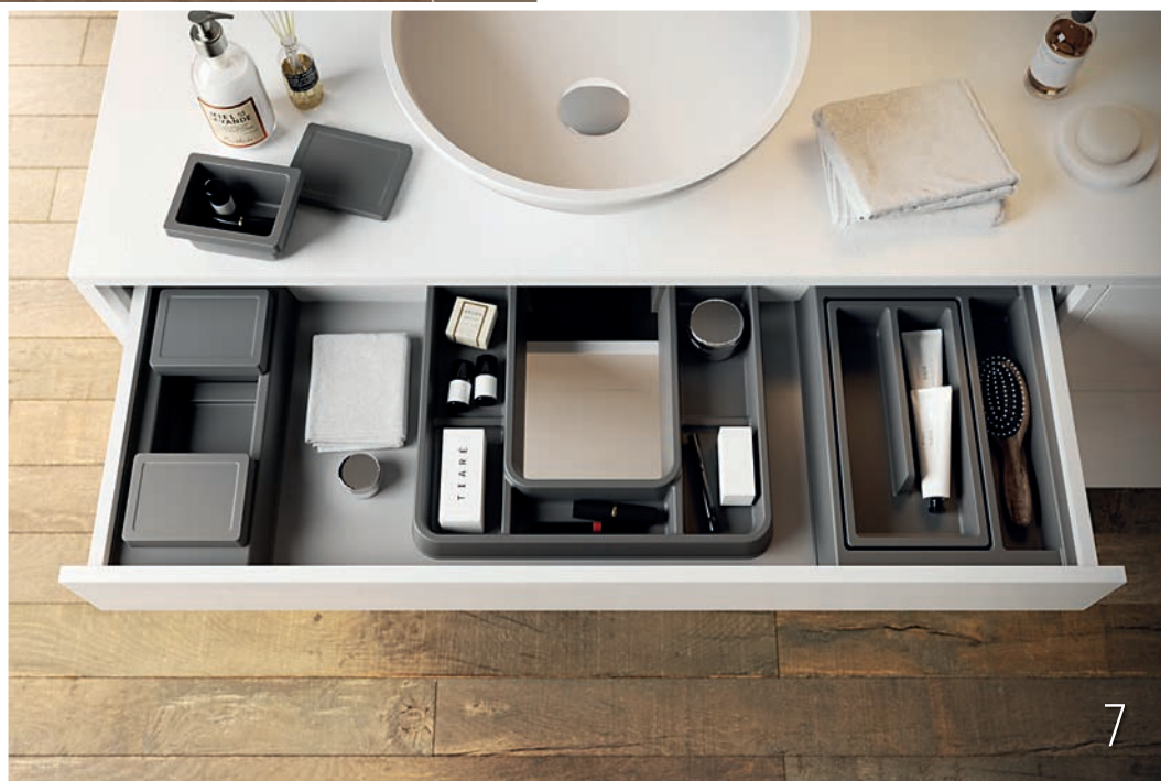
7. "Orgadraw" es un set de divisores para cajones diseñado por DECOSAN para organizar el interior de los muebles de baño. Permite adaptar el espacio del cajón para guardar cosméticos, productos de higiene, toallas, etc. www.decosan.com